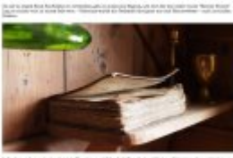
Die in Island meist verwendeten Papierarten sind aus Holz geblendet und werden in Island hergestellt.