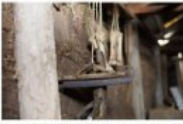
Die Holzbohle, die den Boden des Stallens ausfüllt, ist ein Produkt der heimischen Holzindustrie.