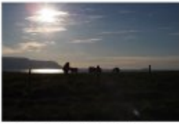
Einmal Nordisland und dann die Küste der Westküste von Island.