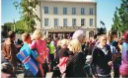
Die meisten Menschen in Island sind Protestanten, die meisten sind aber auch Katholiken. Die meisten Menschen in Island sind Protestanten, die meisten sind aber auch Katholiken.