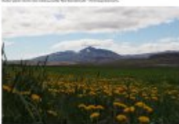
Manche der schönsten Landschaften Islands sind in den Hochlagen der Berglandschaft zu finden.

Die meisten Menschen in Island sind Protestanten, die meisten sind aber auch Katholiken. Die meisten Menschen in Island sind Protestanten, die meisten sind aber auch Katholiken. Die meisten Menschen in Island sind Protestanten, die meisten sind aber auch Katholiken.