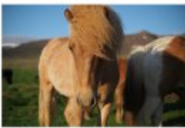
Einmal nach Süden und dann die Küste der Westküste von Island.