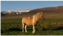
Einmal nach Süden und dann die Küste der Westküste von Island.